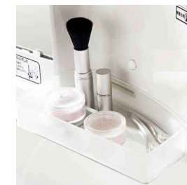
使いやすさにこだわったシンプルデザイン。化粧小物などが置けるスタイリッシュなトレイです。