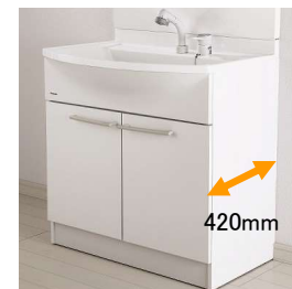
本体キャビネットは奥行き420mmのコンパクト設計です。