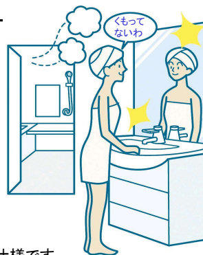
※3面鏡の場合センターのみの仕様です。

電気代ゼロで、全面クリア。新感覚のミラーです。鏡の表面に、吸水性・親水性のある膜をコーティング。一部分しか効果のなかった従来品に対し、全面がくもりにくいいため、お風呂上がりも鏡はいつもクリア。電気代もかからないので経済的です。