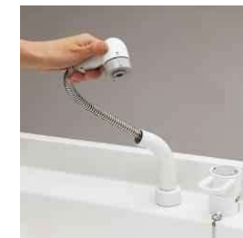
コンパクトで水はねにくいシングルレバーシャワー。洗髪時はリフトアップでき、両手が使えます。