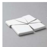
※弊社基準に基づき行った実験結果であり、製品の耐久性を保証するものではありません。