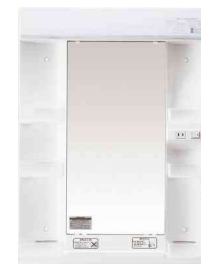
1面鏡 パルック蛍光灯タイプ。洗面ボールと調和したストレート形状です。