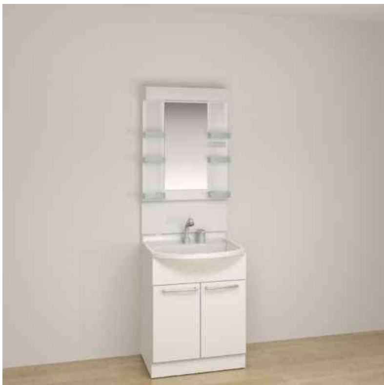
※画像はイメージです。組合せなどはお見積書をご確認ください。