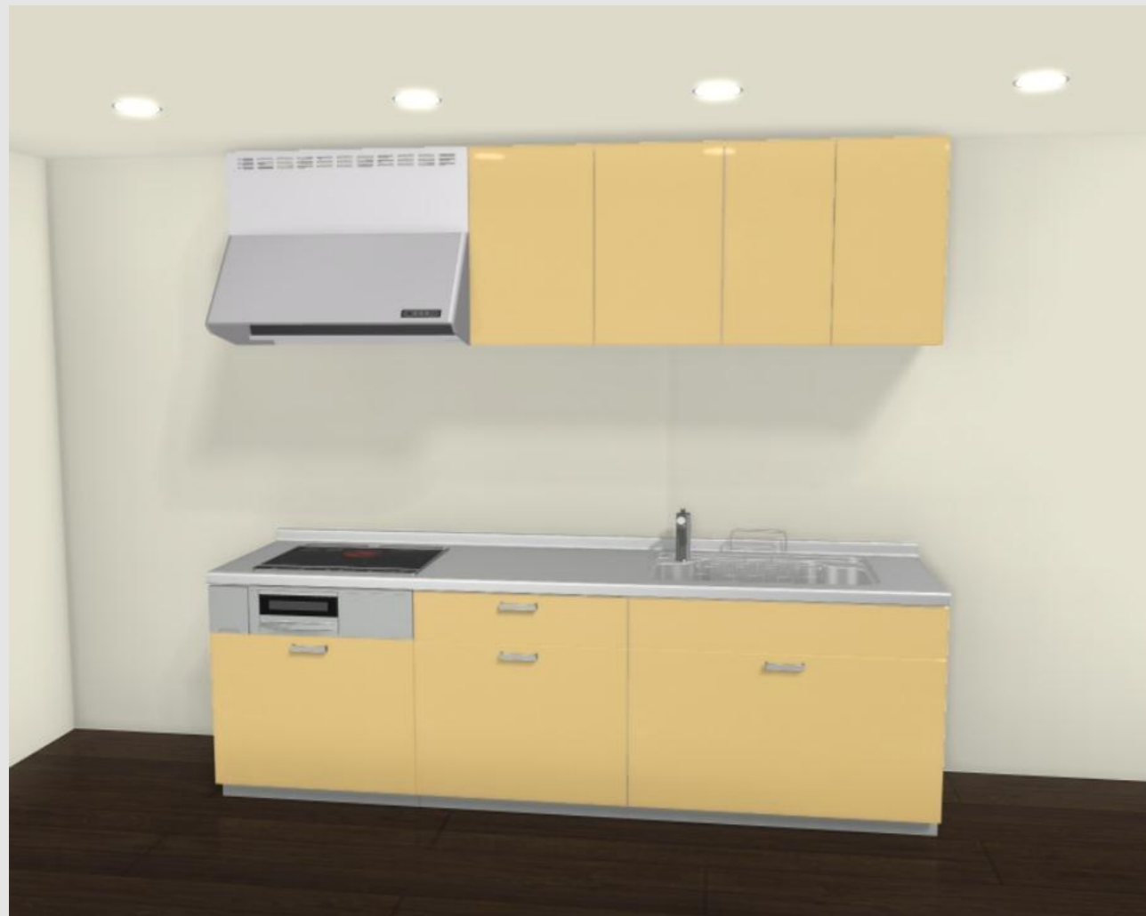
CG合成によるイメージ画像です。 現場調達品、シリーズ外選定品に関しては表現しておりません。