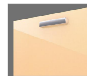
ショートハンドル取手